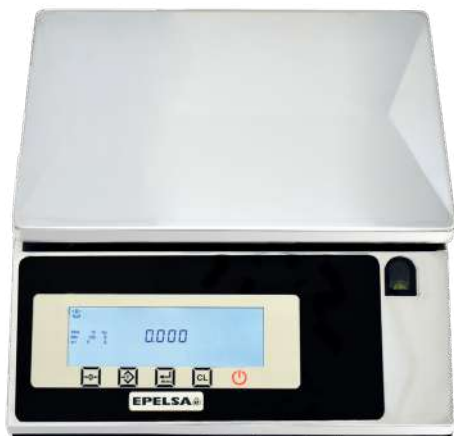
Display LED y teclado de 5 teclas

La balanza SOLO PESO INOX está homologada para la CE y garantiza la calidad y seguridad que necesitas en tus operaciones de pesaje.