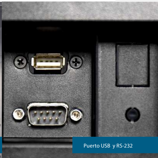
Puerto USB y RS-232