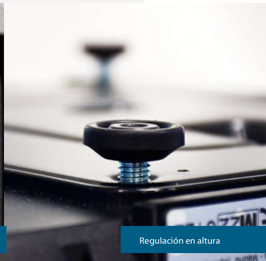
Regulación en altura