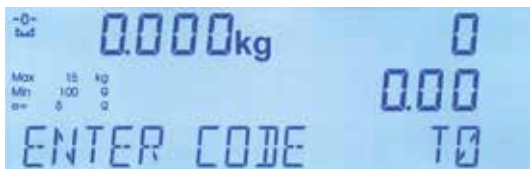
Display LCD retroiluminado